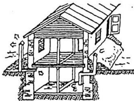
Противорадиационное укрытие в подвале дома